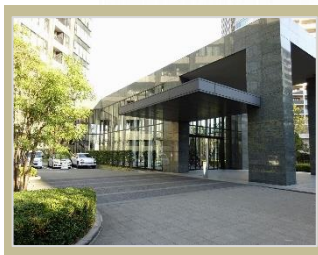
グランドエントランスの 車寄せスペース