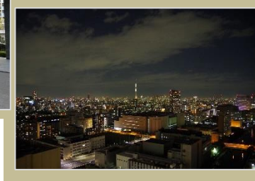
バルコニーからのスカリーツリー