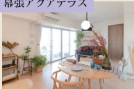
幕張アクアテラス