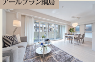
アールプラン綱島