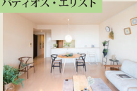
パティオス・エリスト