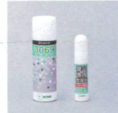
錠前潤滑スプレー 3069

【標準型】スプレー-3069 (内容量70ml) 【写真型】スプレー-3069S (内容量12ml) ※兼用スプレー-3069L (内容量480ml) もあります。